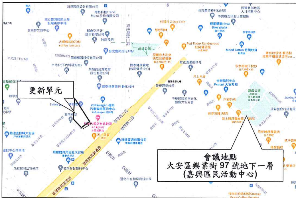
圖 2 會議地點示意圖